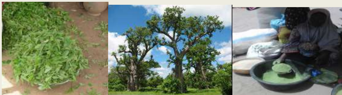
Table de composition physicochimique et valeur nutritionnelle

Fiche 40 : Feuilles de Adansonia digitata