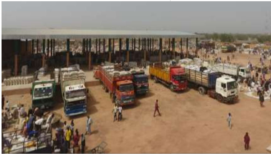
Marché de Tessaoua, Niger, 2017