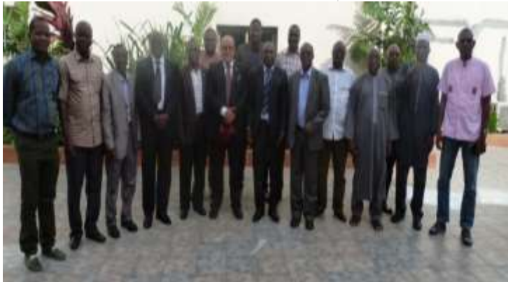
Retraite PRA-Marchés, Abidjan, Novembre 2017

L'Institut du Sahel a participé à une rencontre de consultation de haut niveau entre le CORAF/CILSS/CIRAD en décembre 2017 à Dakar au Sénégal où le DG de l'INSAH représentait le Secrétaire Exécutif du CILSS au conseil d'administration du CORAF.